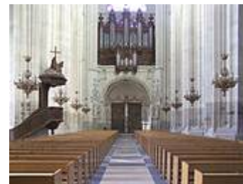
A gauche de la nef : La chaire