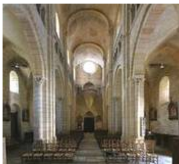
La nef et ses bas-côtés

Dans les églises anciennes, la nef est précédée d'un porche, le narthex . C'est de là que les croyants non-baptisés assistaient aux cérémonies religieuses. A l'entrée de la nef sont disposés des bénitiers .