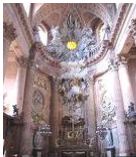
Chœur de l'église