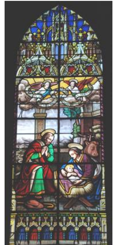
Naissance de Jésus