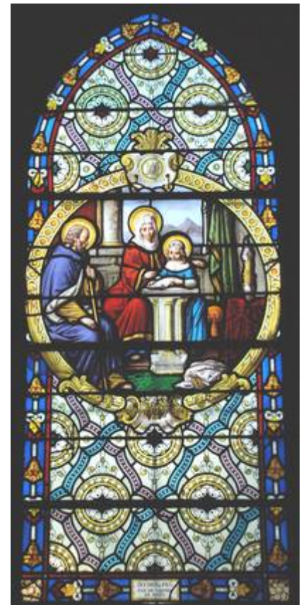
Marie enfant apprend à lire