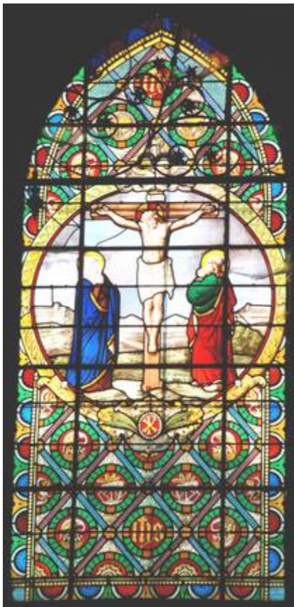
Marie au pied de la croix