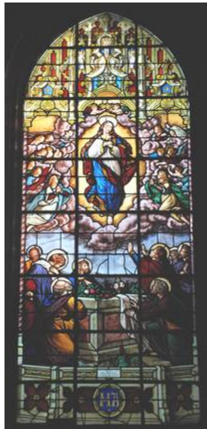
Marie monte au ciel