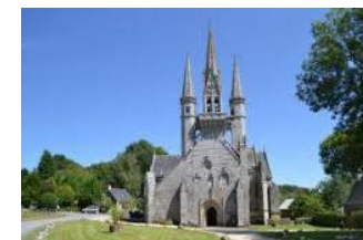
Chapelle Saint Fiacre

Récollecion mardi 12 juin 2018 organisée par le MCR