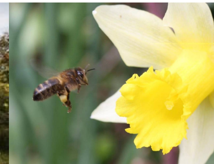
Musée de l'abeille vivante

Je m'inscris à la récollecion MCR du 12 juin 2018