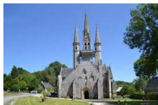
Chapelle Saint Fiacre

Récollecion mardi 12 juin 2018 organisée par le MCR