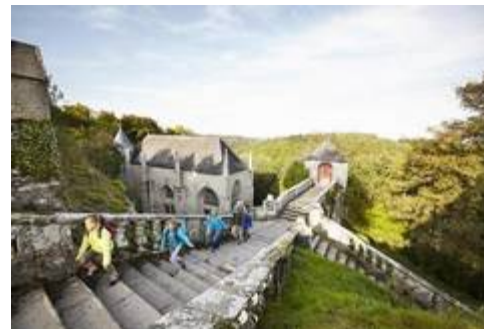
La chapelle Saint Barbe

Pour des questions de réservation nous vous demandons de nous retourner votre inscription avant le 15 mai (Tarif 45 euros)