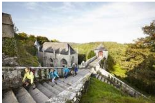
La chapelle Saint Barbe

Départ à 8h30 du champ de foire et retour vers 18h00